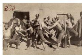
پهلوانان - ۱۹۱۹

آیا توانستیم لااقل در زمینه هنر عقب‌مانگی را جبران کنیم؟