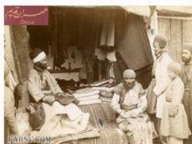
لباس دست‌دوم فروشی تاناکورای ۱۹۰۷