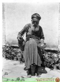
سقا - ۱۹۲۰